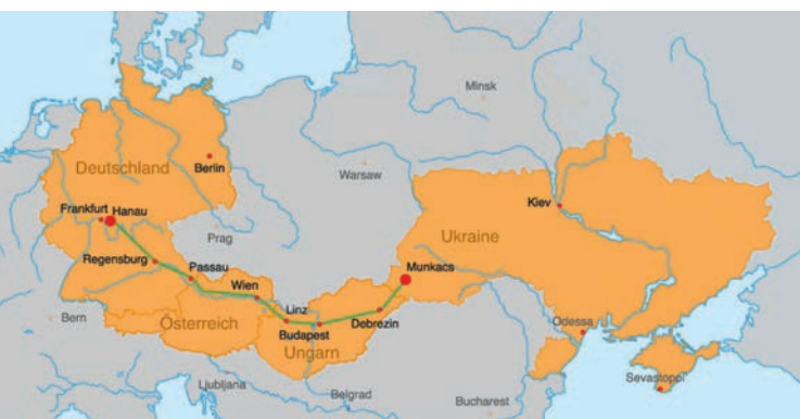
1340 km von Hanau nach Munkacs