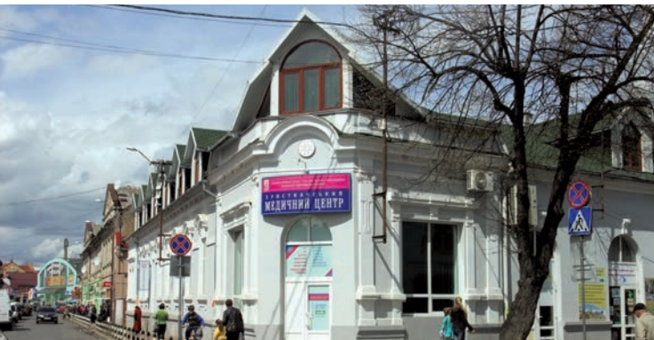
Christian Medical Center, Mukachevo (Munkacs)